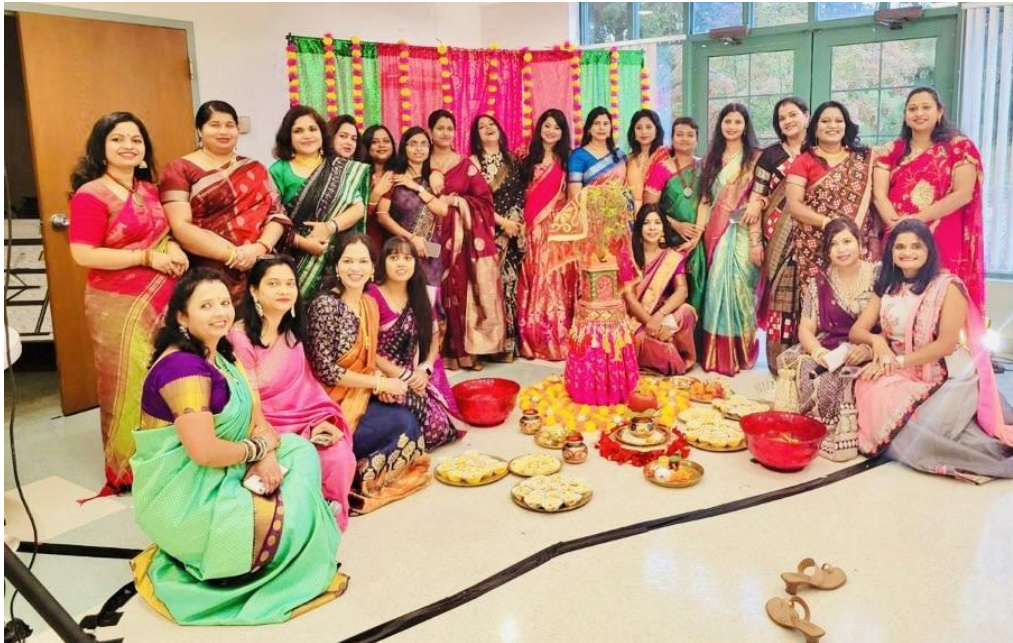
Kumar Purnima Celebration