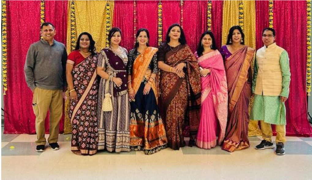
OSNE Executive Team