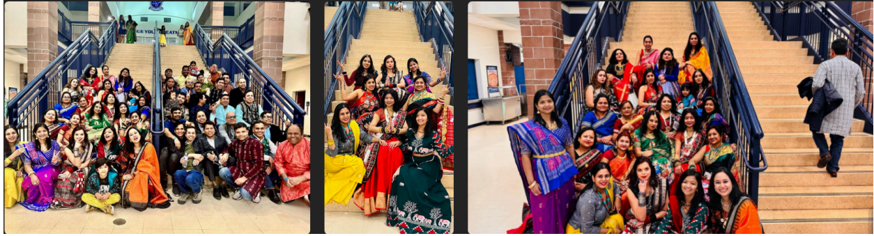
The Odisha Society Of The Americas